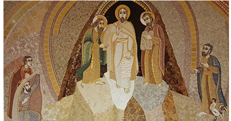
Ivan Marko Rupnik, Trasfigurazione , Agosto – Settembre 2015 SANTUARIO NAZIONALE DI SAN GIOVANNI PAOLO II A WASHINGTON Cappella della reliquia Parete di fondo