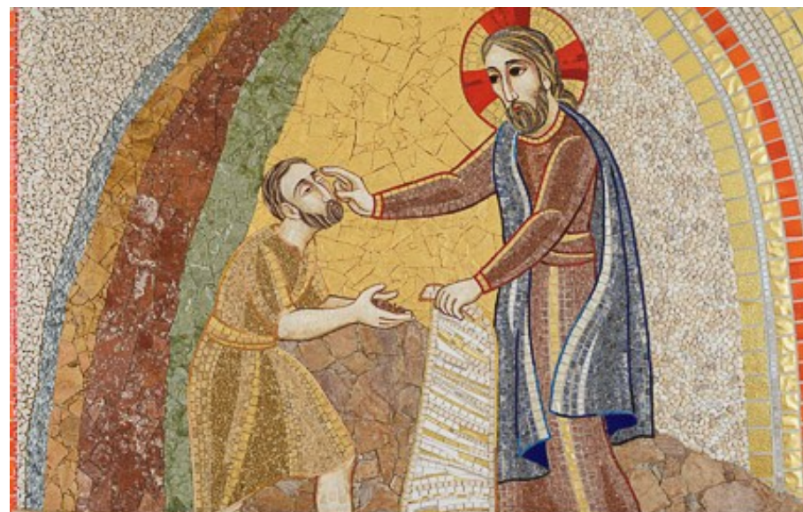
CENTRO DI SPIRITUALITÀ S. DOROTEA AD ASOLO Parete di fondo sinistra