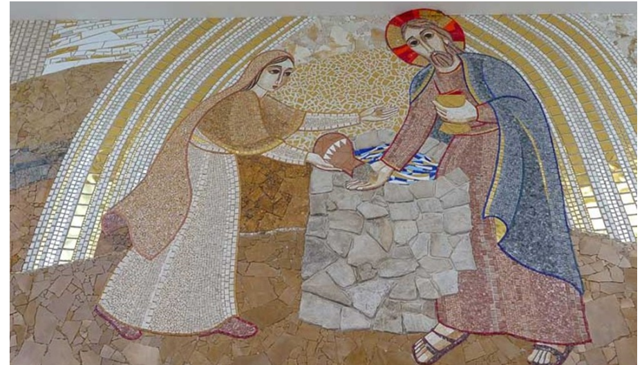
Ivan Marko Rupnik, Gesù e la samaritana , Dicembre 2017 CHIESA DELLA MADONNA DELLA CROCE DEL SUD A BRISBANE Ingresso