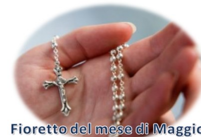
Fioretto del mese di Maggio

Domenica 1 maggio alle ore 18, apertura solenne del mese di maggio nella chiesa parrocchiale con la consegna dell'immagine mariana da portare nei luoghi del fioretto (basi missionarie). Invitiamo a prendere visione del programma dettagliato. Il fioretto si terrà all'aperto. In caso di maltempo potrà essere fatto presso la famiglia che si renderà disponibile. Raccomandiamo di non aver paura ad aderire: le autorità sono state avvisate. Abbiamo il coraggio di testimoniare pubblicamente la fede dandone visibilità anche attraverso la preghiera comunitaria. Uniamoci al Santo Padre nella preghiera perché il Signore ci liberi dall'orrore della guerra e ci doni una primavera di pace.