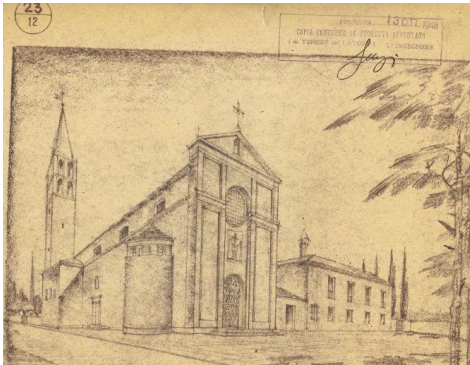
Progetto della Chiesa (1948)

La Parrocchia della Sacra Famiglia è situata nella zona sud-ovest della città di Ferrara, all'interno della circoscrizione di via Bologna. Si estende su di un territorio di circa 6 Km2 ed ha una popolazione di circa 14000 parrocchiani. La zona è di insediamento intensivo recente (dal dopoguerra in poi) ed ha avuto un notevole sviluppo economico edilizio e demografico nel corso degli ultimi decenni.